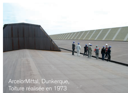
ArcelorMittal, Dunkerque, Toiture réalisée en 1973