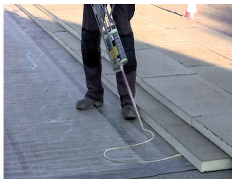
DERBITECH® Powered Applicator