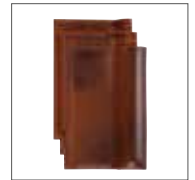
Brun Havane Engobe [couleur nuancée]