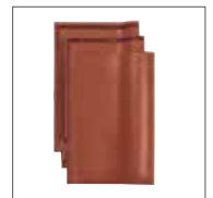
Rouge Cuivre Engobe