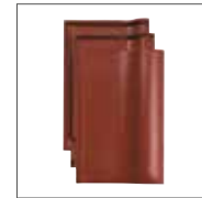
Rouge Lie-de-vin Engobe