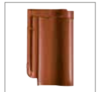
Rouge Cuivre Engobe