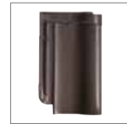
Brun Foncé Engobe