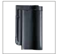
Gris Schiste Engobe