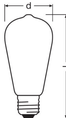
ST EDISON 40 4 W/2700K E27, LEDISON CLAS ST 40 4.5 W/2700K E27, ST EDISON 55 6.5 W/2700K E27, LEDISON CLAS ST 55 6.5 W/2700K E27