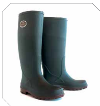
Litefield - réf. S0100/5170