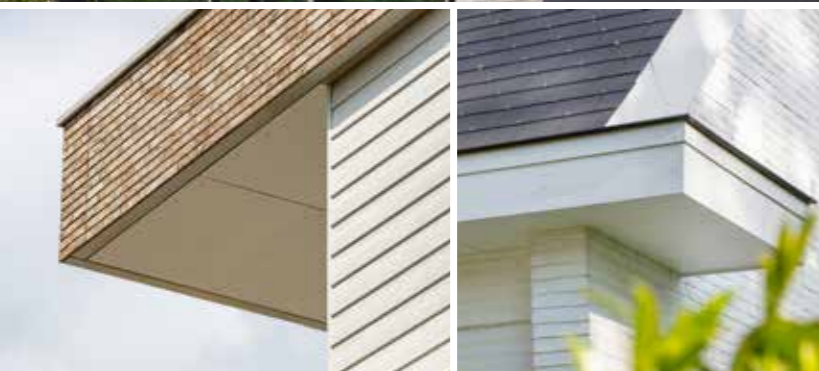
Buitenplafond in Cedral Board