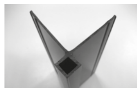
Buitenhoek 12 x 12 x 60 x 60 L= 2,5m PVC zwart