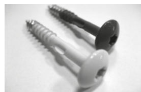
Schroef Torx met vleugels 4,8 x 38 RVS