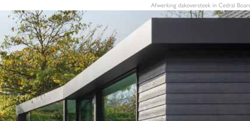
Afwerking dakoversteek in Cedral Board