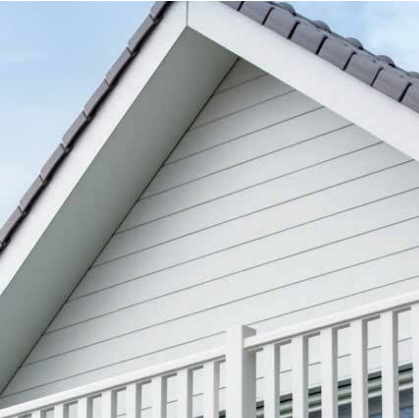
Geveldeel afwerking in Cedral Board

Dakrand - bakgoot - dakvenster - boeiboord - geveldeel